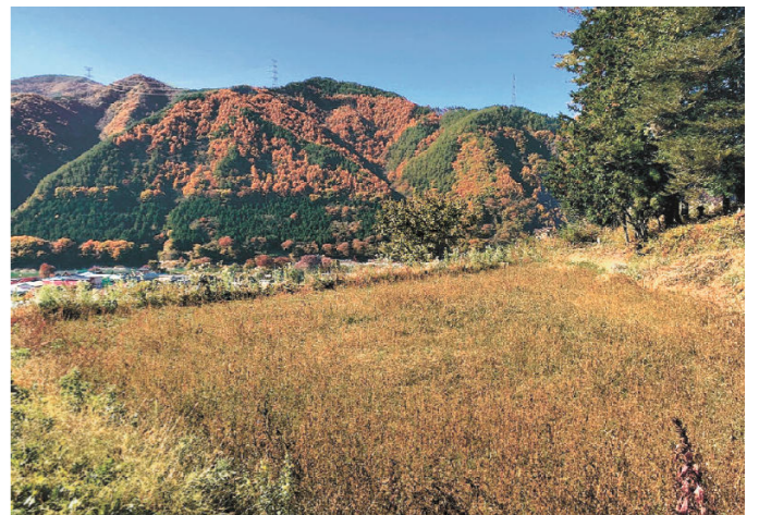
伊那市長谷にある耕作されていない水田。ハワイ向けにコメを生産する予定だ。11月

国産米の海外輸出を手掛ける「Wakka Japan(ワッカジャパン)」(札幌市) が来月1月伊那市長谷に農業生産法人を立ち上げ、米の生産を始める。玄米のまま輸出したコメを現地では「ワカメ」で呼ばれる同社が、自主生産は初めての試み。海外消費者の健康志向をうけて、農業や化学肥料を極力使わない考えで、担い手不足や耕作放棄地の拡大といった課題を抱える山村農業の「一つのモデルになれば」と関係者は意気込んでいる。