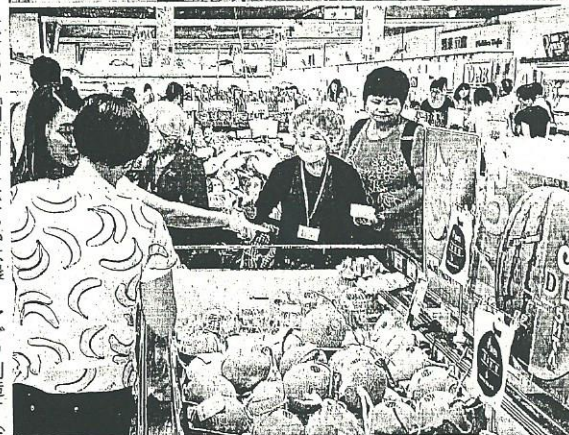
③香港のスーパーに並んだ「夕張メロン」。輸出は、可能性への挑戦の一つという＝2014年7月 ④香港のイオンで人気を集めた三笠メロン＝2015年7月 ⑤香港のスーパーマーケットに陳列された「らいでんメロン」＝2015年9月